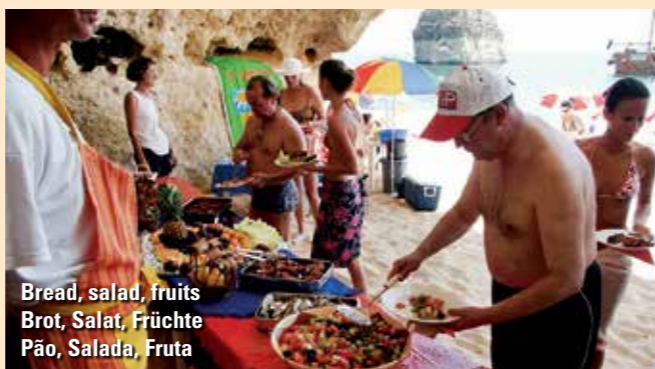
Bread, salad, fruits Brot, Salat, Früchte Pão, Salada, Fruta