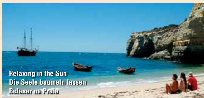
Relaxing in the Sun Die Seele baumeln lassen Relaxar na Praia