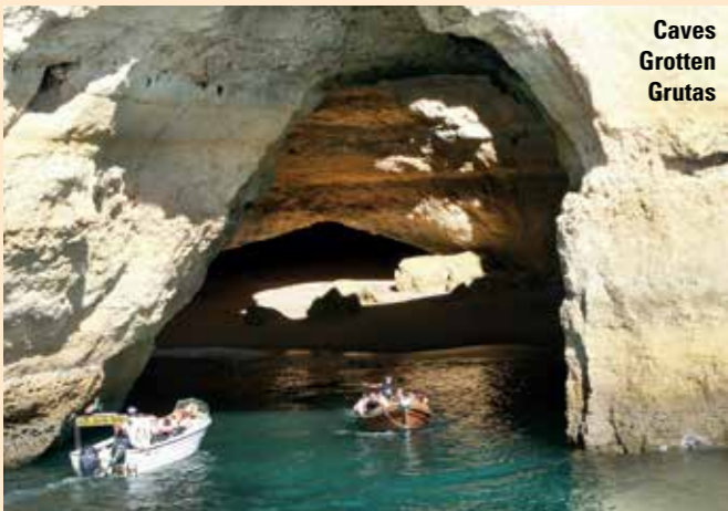
Caves Grotten Grutas

Boarding is at the pier “Cais Vasco da Gama”, close to Clube Naval and museum in Portimão.